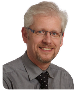
ZT Erik Lauter Rübeling+Klar Dentallabor GmbH

Sicher sehen Sie jeden Tag Patienten mit Zahnfehlstellungen. Unser Aligner-Konzept ist die Antwort auf die Nachfrage nach kurzer und ästhetischer Behandlung für diese Patienten. Die Besonderheit unseres Systems nach Dr. Echarri liegt in den für jeden Behandlungsschritt einzeln erstellten Schienen (Aligner). Diese werden für jeden Schritt in jeweils drei verschiedenen Stärken (Soft, Medium und Hard) mithilfe des BIOSSTAR®-Druckformgeräts gefertigt.